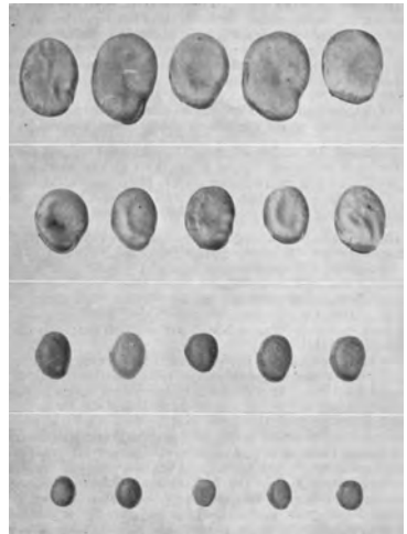
Van boven naar beneden: Waalse bonen, Paardebonden, Wierdebonen en Duivebonen

Toepassing: De Wier(de)boon wordt gebruikt als veevoer.