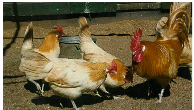
Zandgelen bij Vijversburg

De Fryske Hinneklub demonstreert in dit kader op zaterdag 9 september in Vijversburg bij Zwarte-wegsend in het fokcentrum de kleurslagen van de Friese hoenders. Andere houders van Friese rassen of gewassen kunnen zich voor deelname melden via info@werkverband-frieserassen.nl dat een deel van de publiciteit verzorgt.