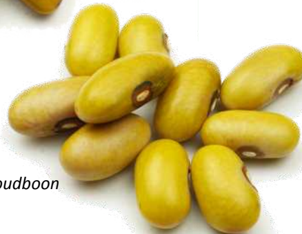
Friese Gele Woudboon

Tijdens de Vlasroute 'Follow the blue line' in Noord-OostFryslân kon het publiek kennis maken met een vlasveldje. De dertien door Joris Viëtor in stand gehouden Friese vlasrassen werden er getoond.