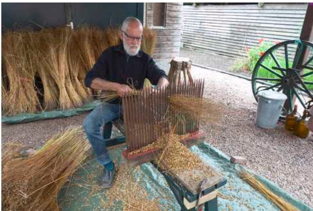
In stand houden (vlas)

In voorafgaande afleveringen van OER werd duidelijk dat er geen schot komt in een Platformproject dat bedoeld is om Friese rassen en gewassen toe te passen door ze te vermarkten. Mogelijke subsidiënten brachten er tegen in dat het wel geen toeval zal zijn dat de rassen en gewassen waar het dan om gaat van de markt zijn geraakt. Toch had dat