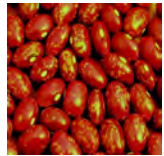
Reade krobbe of Krúpke