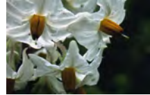
Bloesem van het Bintje