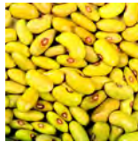
Friese gele woudboon of Fryske gele wâldbean

Er zijn drie soorten droge bonen die bij Fryslân horen. Dit zijn: de Friese gele woudboon (Fryske gele wâldbean), de Reade krobbe (ook wel Krúpke genoemd) en de Leverkeurige boon . Droge bonen heten zo, omdat de bonen na de oogst uit de peul worden gehaald en vervolgens worden gedroogd. Gedroogde bonen zijn goed te bewaren.