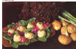
Aardappelpuree met bieslook

De belangrijkste voedingsstof in aardappelen is zetmeel. Er komen ook vitamines in voor. Als je ze in een halfdonkere en koude ruimte bewaart, kunnen ze tot in het nieuwe jaar gegeten worden. Behalve patates frites, kun je er bijvoorbeeld aardappelsalade, aardappelpuree en aardappelchips van maken.